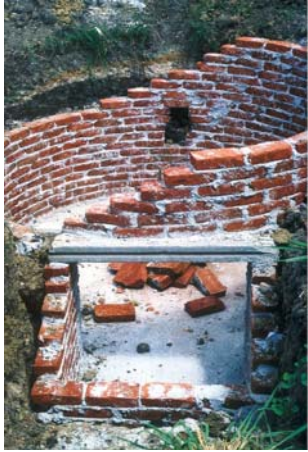
Links: Biogasanlage im Bau. Das Gas wird zum Kochen und zur Beleuchtung in den Häusern der Bauern eingesetzt. Acht dieser Anlagen haben wir in Sancti Spiritus mit Spendengeldern finanziert. Unten: Siboney-Milchkuh auf ausgedehnter Weidefläche.

Im Sinne einer regional angepassten Produktion soll in der Milchproduktion weitgehend auf importierte Betriebsmittel verzichtet und die Verwertung lokaler Futterressourcen optimiert werden. Damit verbunden ist eine Doppelnutzung der Rinder für Milch- und Fleischproduktion und ein Verzicht auf maximale Einzeltierleistungen. Durch die Nutzung alternativer Energiequellen, vor allem Biogas und Solarenergie, soll die Energieversorgung stabilisiert und perspektivisch eingebunden werden in ein integriertes Nährstoffrecycling auf allen Farmen.